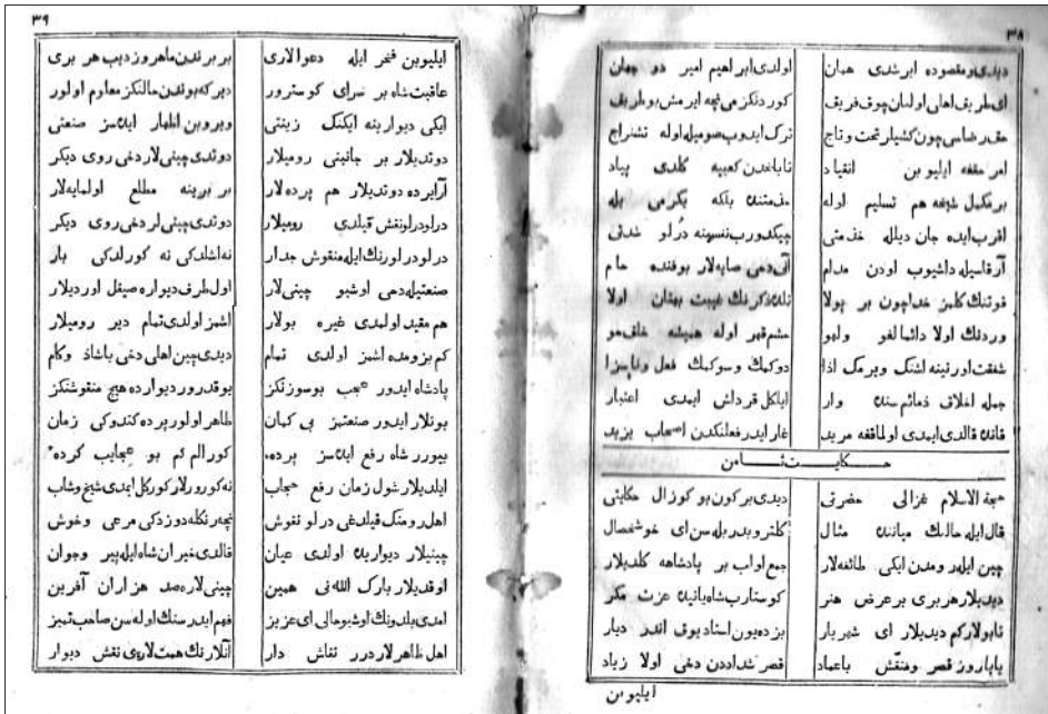
Ә. Каргалыйның «Тәржемәи хажи Әбелмәних әл-Бистәви әс-Сәғыйди» жыентыгындагы «Сигезенче хикәят»нең беренче битләре