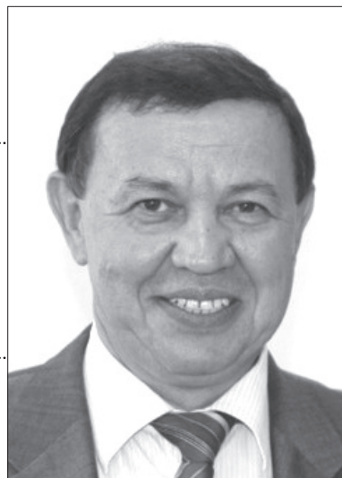
М. Х. СƏЛАХОВ Татарстан Республикасы Фәннәр академиясе президенты